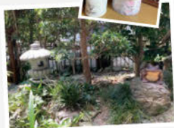
秀道さんが作った庭